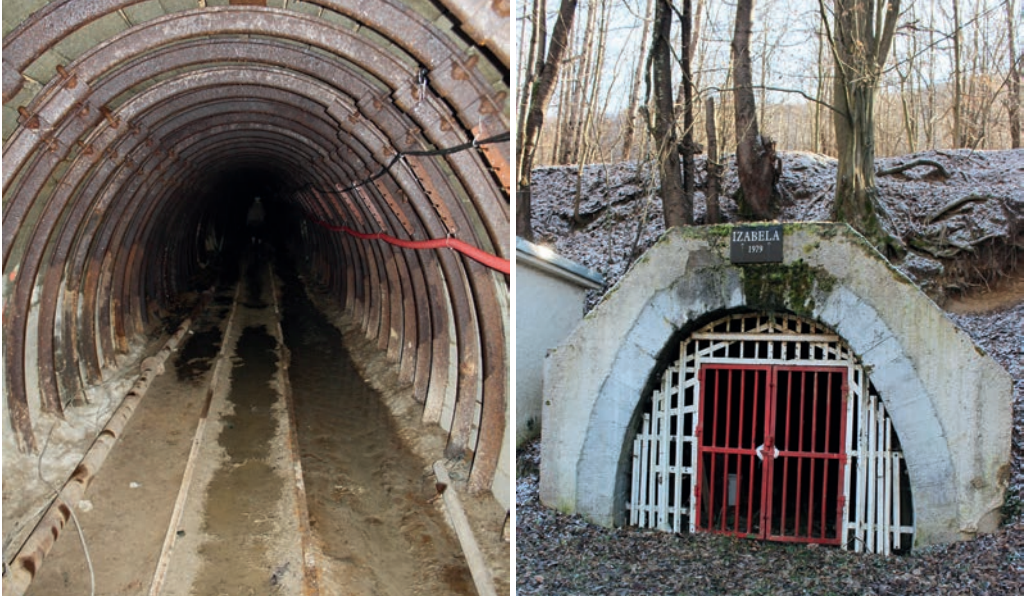
Obr. 1, 2. Štôľňa Izabela. 1 – štôľňa bola vyrazená v migmatitoch masívu Skleného vrchu. 2 – portál štôľne. Figs. 1, 2. The Izabela mining tunnel. 1 – the tunnel was made in the migmatite massif of the Sklený vrch hill. 2 – entrance to the Izabela mining tunnel.