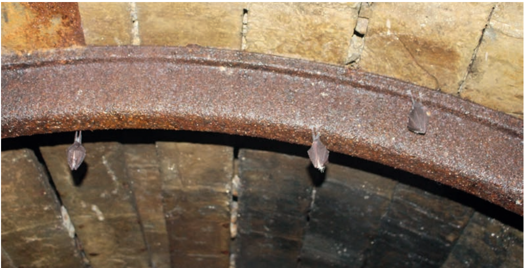
Obr. 3. Zimujúce podkováre malé ( Rhinolophus hipposideros ) na horných častiach nosníkov v štôľni Izabela.